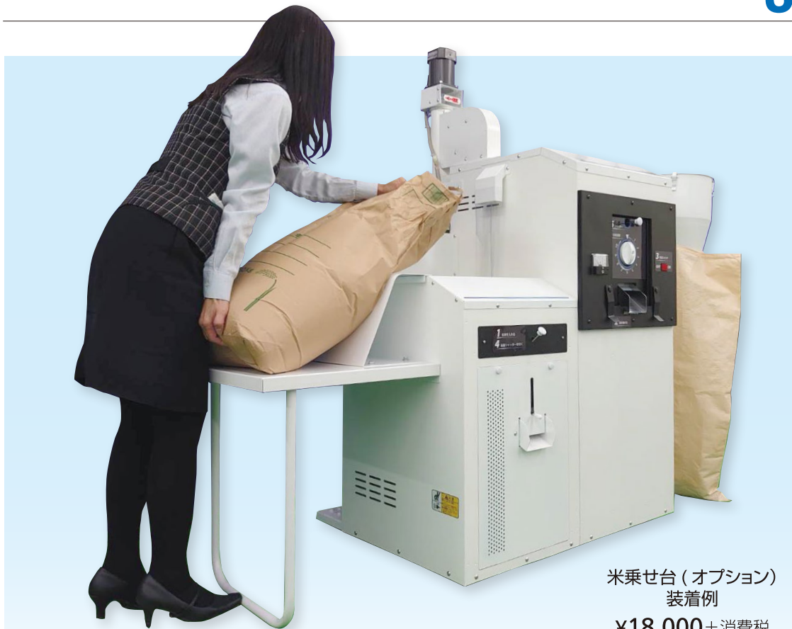
米乗せ台 (オプション) 装着例 ¥18,000+消費税