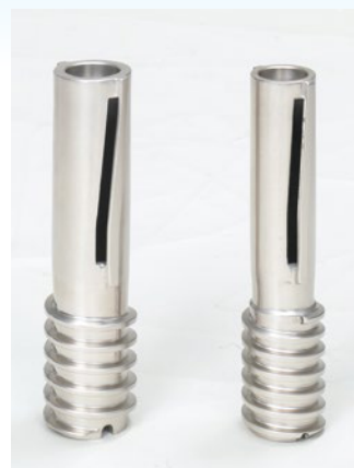
SR3770RD 専用大型ロール (左)